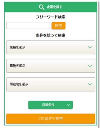
スマートフォン用画面

昨今の売り手市場の採用状況で、ネームバリューのある大手企業に学生が集まるなか、採用意欲のある投資先中小企業からのニーズに応じて開設しました。