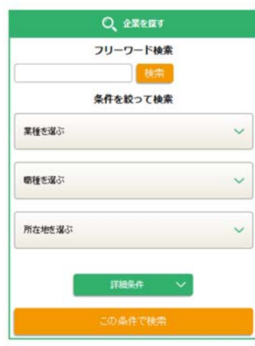
スマートフォン用画面

「投資育成キャリアナビ」は、ネームバリューのある大手企業に学生が集まる売り手市場のなか、採用意欲のある投資先中小企業の声を受けて開設しました。